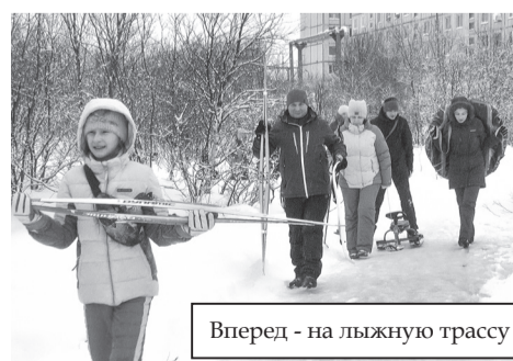
Вперед - на лыжную трассу

Кроме того, все желающие смогли прогуляться по освещенной трассе, берущей начало за домом №18 по улице Заречная. Причем не только пешеходы, но и велосипедисты, большинство жителей уже давно освоили мастерство скандинав-