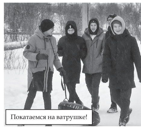
Покатаемся на ватрушке!

Зимние развлечения для детей и взрослых не только разнообразили досуг видяевцев, но и в очередной раз доказали, что здоровый образ жизни, занятия спортом и выходные, проведенные с семьей на свежем воздухе, дарят каждому из нас массу положительных эмоций и, конечно же, укрепляют наше здоровье.