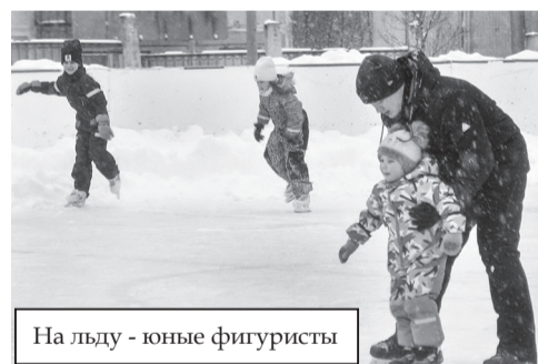
На льду - юные фигуристы

Необычной формой времяпрепровождения стал футбол на снегу, в ко-