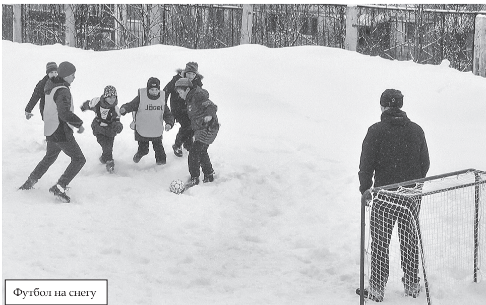
Футбол на снегу