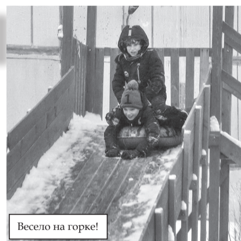
Весело на горке!